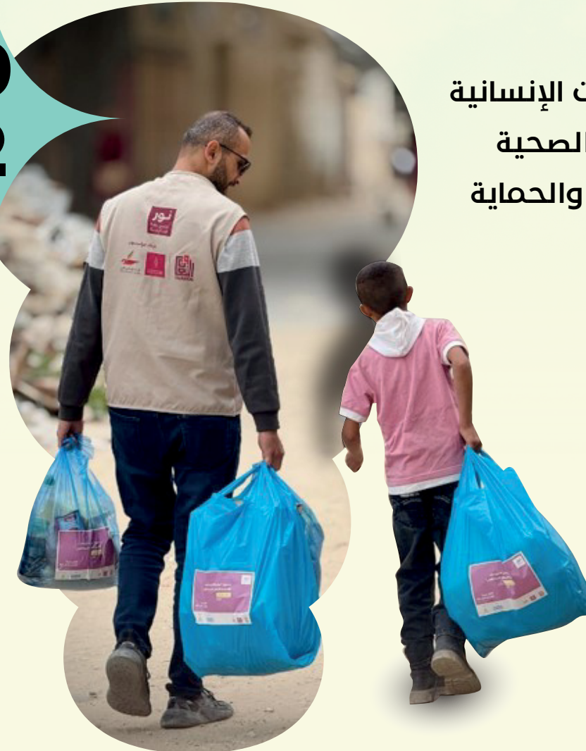
تدخلات برنامج نور لرعاية الايتام