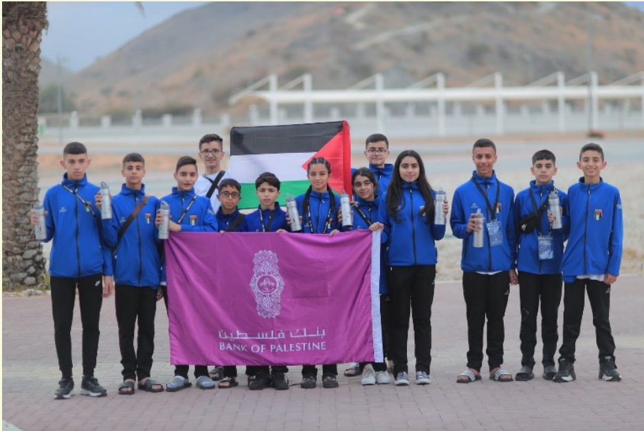
دعم اتحادات رياضية مختلفة