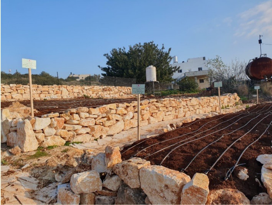
انشاء حديقة بيئية في محمية ام التوت